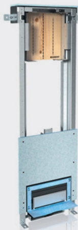
Modulo Geberit Combifix per docce, altezza 130 cm con scarico a filo pavimento e supporto per rubinetti ad incasso. Possibilità d'installazione ad angolo