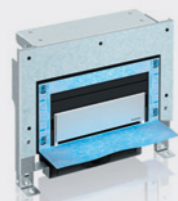
Modulo Geberit Combifix per docce, altezza 34 cm con scarico a filo pavimento