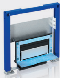
Modulo Geberit Duofix per docce, altezza 50 cm con scarico a filo pavimento