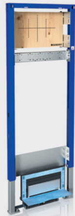
Modulo Geberit Duofix per docce, altezza 130 cm con scarico a filo pavimento e supporto per rubinetti ad incasso