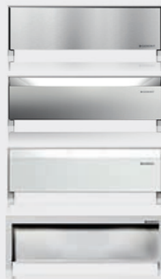
Coperture per moduli d'installazione docce