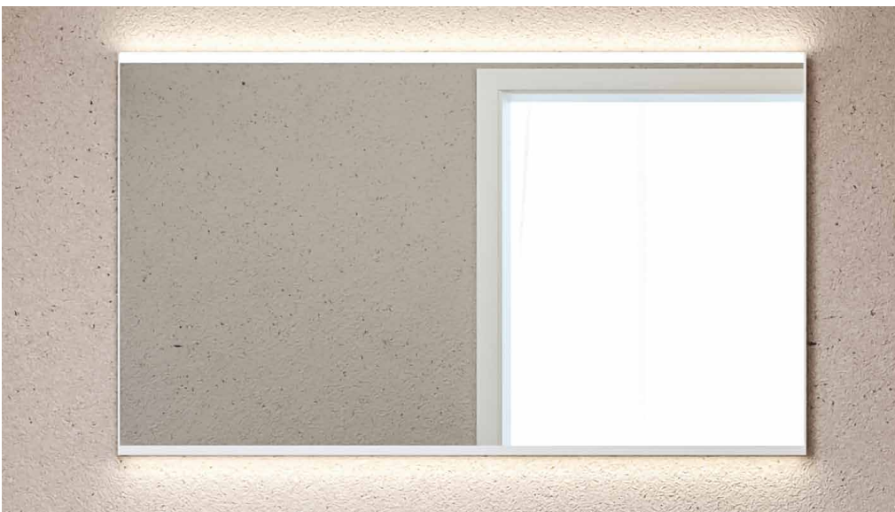
← Specchio Geberit Option Plus rettangolare con illuminazione diretta e indiretta.

Un sistema pensato per semplificare la progettazione e offrire massima libertà creativa, con oltre 350 possibili combinazioni e soluzioni modulari.