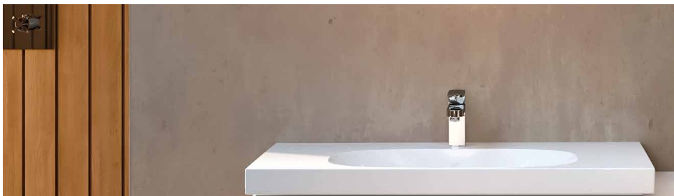
← Lavabo Geberit Acanto, scarico verticale.