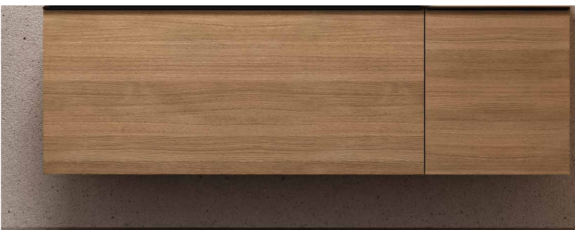
← Mobile Geberit Acanto e mobile laterale sospeso con cassetto, finitura rovere.