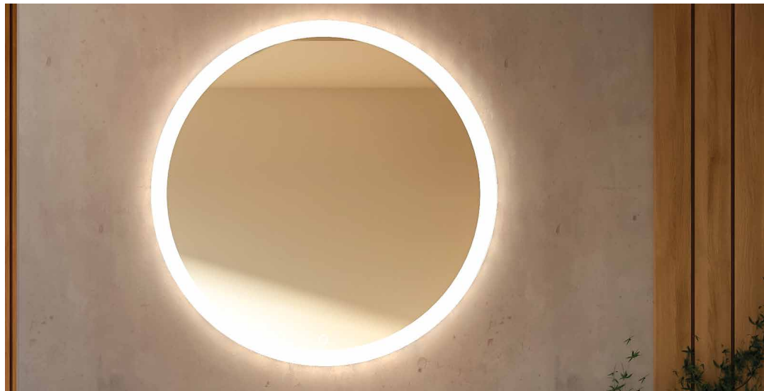
→ Specchio Geberit Option rotondo con illuminazione diretta e indiretta.

Un approccio progettuale che valorizza spazio, stile e personalità, offrendo la possibilità di esprimere i propri gusti attraverso combinazioni sempre diverse.