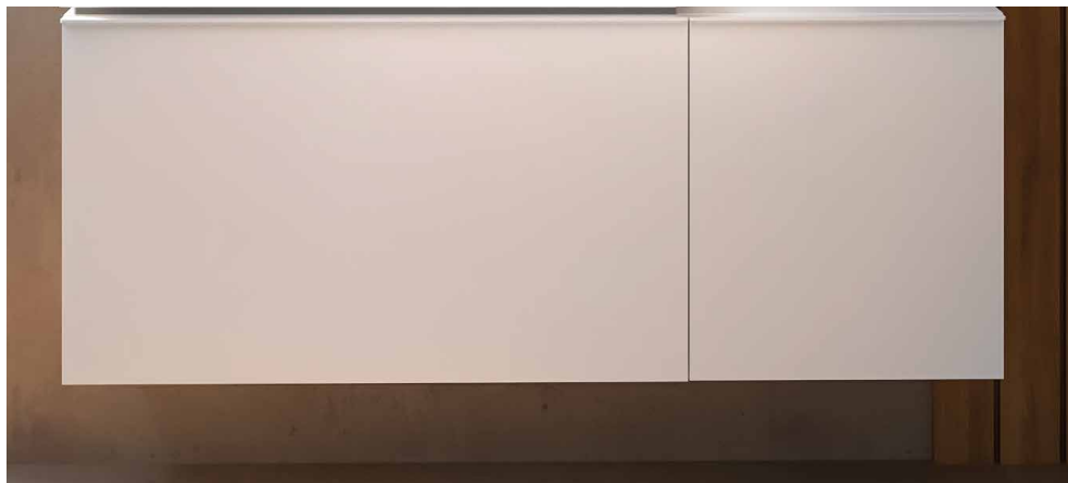
→ Mobile Geberit Acanto e mobile laterale sospeso con cassetto, finitura bianco opaco.